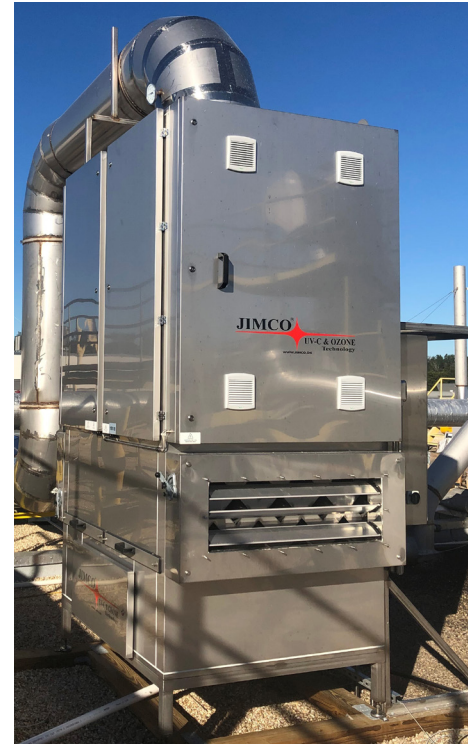
FLO-P med en dør 60 stk. UV-C Lamper 81W eller 165 W-HO lamper