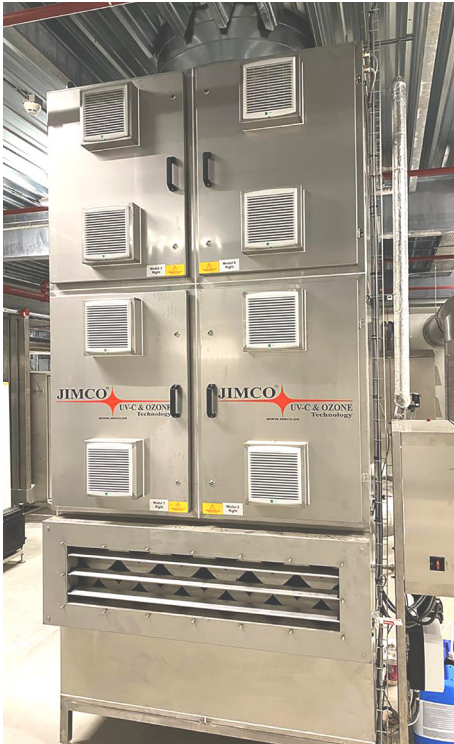
FLO-P med fire døre 150 stk. UV-C Lamper 81W eller 165 W-HO lamper

Professionel og miljøvenlig luftrensning af procesluft og lugtkontrol