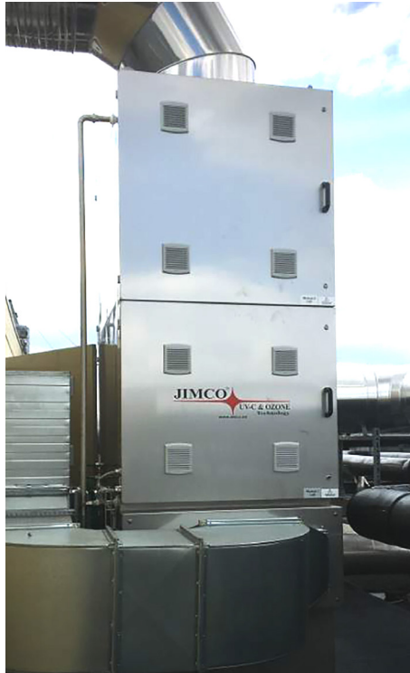
FLO-P med to døre 100 stk. UV-C Lamper 81W eller 165 W-HO lamper