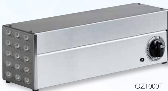
OZ1000T Mit Timer

Länge: 430 mm - Breite: 130 mm - Höhe 130 mm