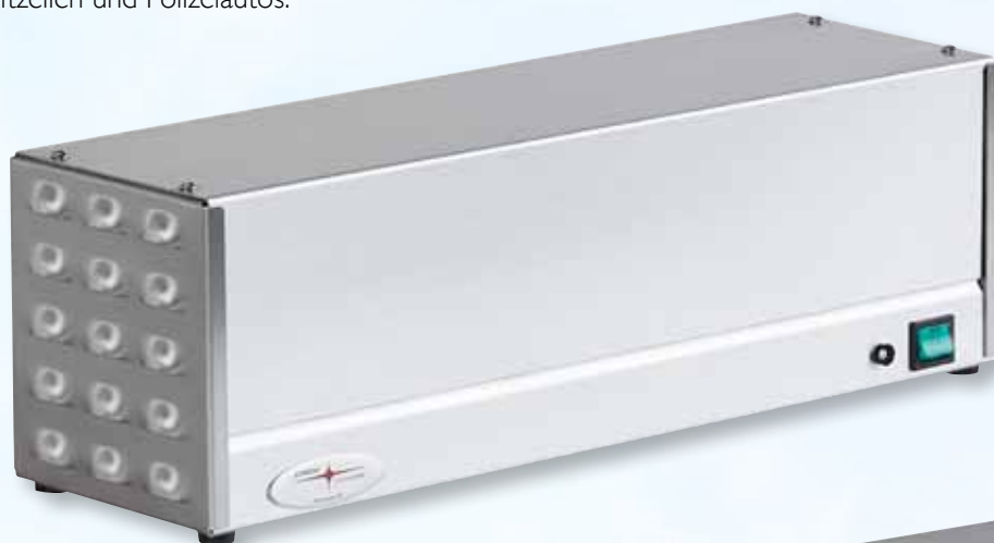
OZ1000 / OZ2000